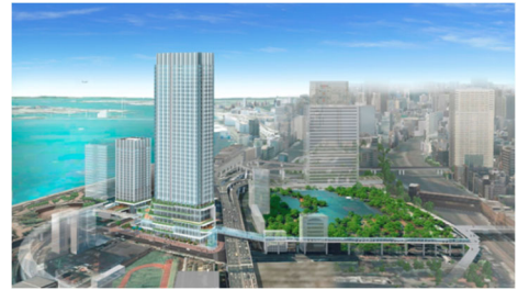
図3 竹芝地区開発計画完成予想図

計画地はJR浜松町駅からほど近い、東京都計量検定所、産業貿易センター、公文書館の3つからなる約1.5haの敷地である。東京都のガイドラインで規定される竹芝地区はこの敷地を含む約28haの範囲となる。事業の特徴は、「約70年間の一般定期借地権設定」、本地区内における「事業期間中のエリアマネジメント業務実施」である。2015年度中に着工し、来る東京オリパラ前の2020年度前半での本施設竣工を予定している。（図3）